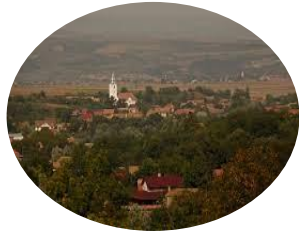
Várfalva Község Polgármesteri Hivatala