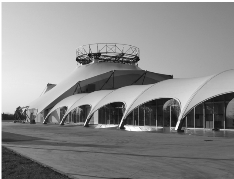
1. ábra. A Pécsi Expo Center I. üteme

A pécsi Expo center is barnamezős területen fekszik, a kertvárost és az egyetemvárost összekötő út mentén helyezkedik el a népszerű pécsi vásártér közelében. Legtöbbször a környezetszennyezés akadályozza a gazdasági terjeszkedést, vagy az ingatlanok újrahasznosítását. A Pécsi Expo újrahasznosított létesítményeinek kármentesítése fontos tényező volt mind szállítási vállalat telephelyén (I. ütem), mind a volt szennyvíztelep területén (II. ütem). A legnagyobb problémát a talaj és az épületek szennyezettsége jelenti. Ráadásul a környezetszennyezésért nem az okozó felel, hanem miután felfedezte a problémát, az új tulajdonos feladata a kármentesítés. A barnamezős rehabilitáció lehetőséget ad a városok környezetbarát módon való újjáélesztésére, a zöldterületek megóvására, a környezetvédelmi és a közlekedési infrastruktúra fejlesztésére.